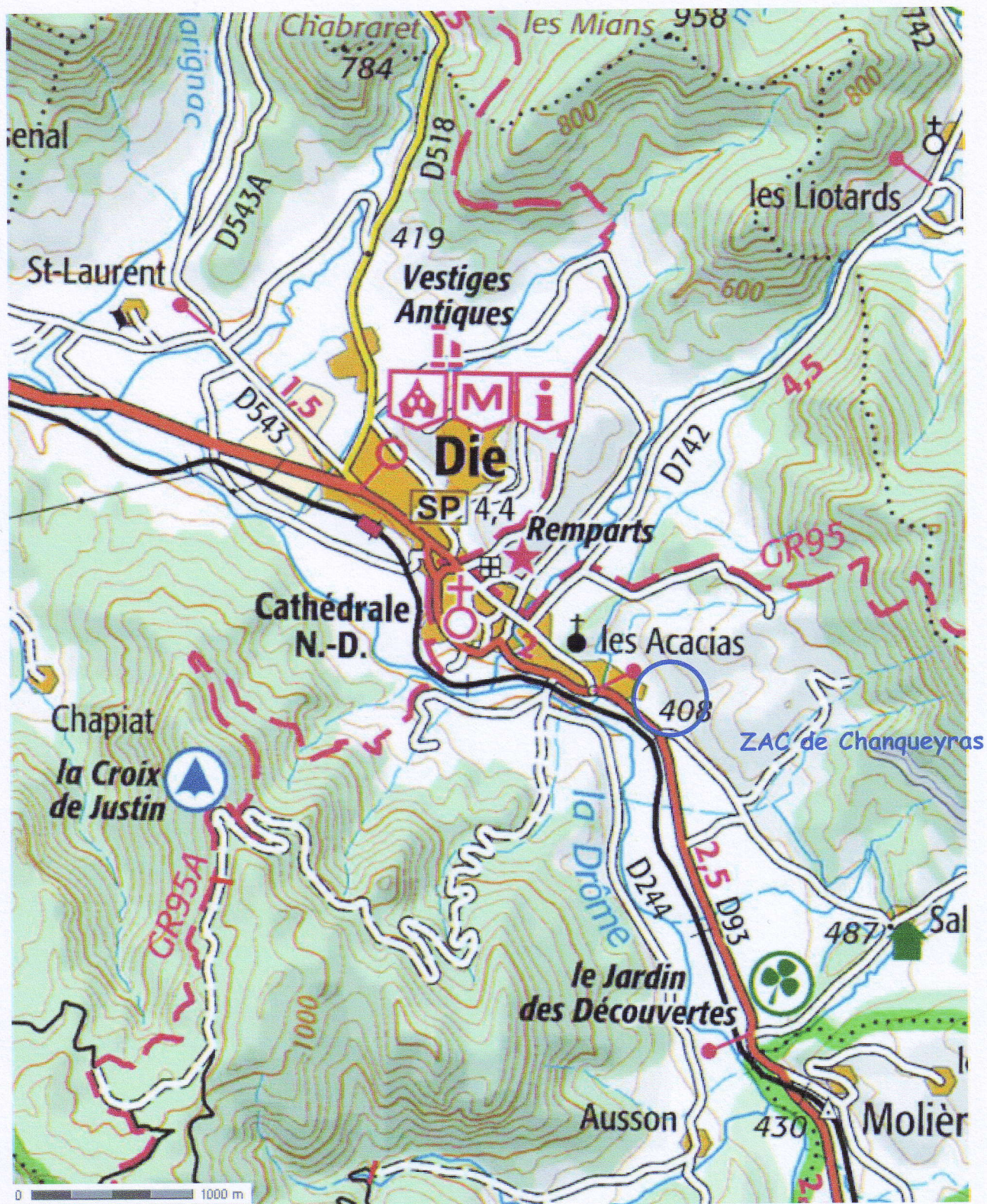
Localisation du projet de ZAC