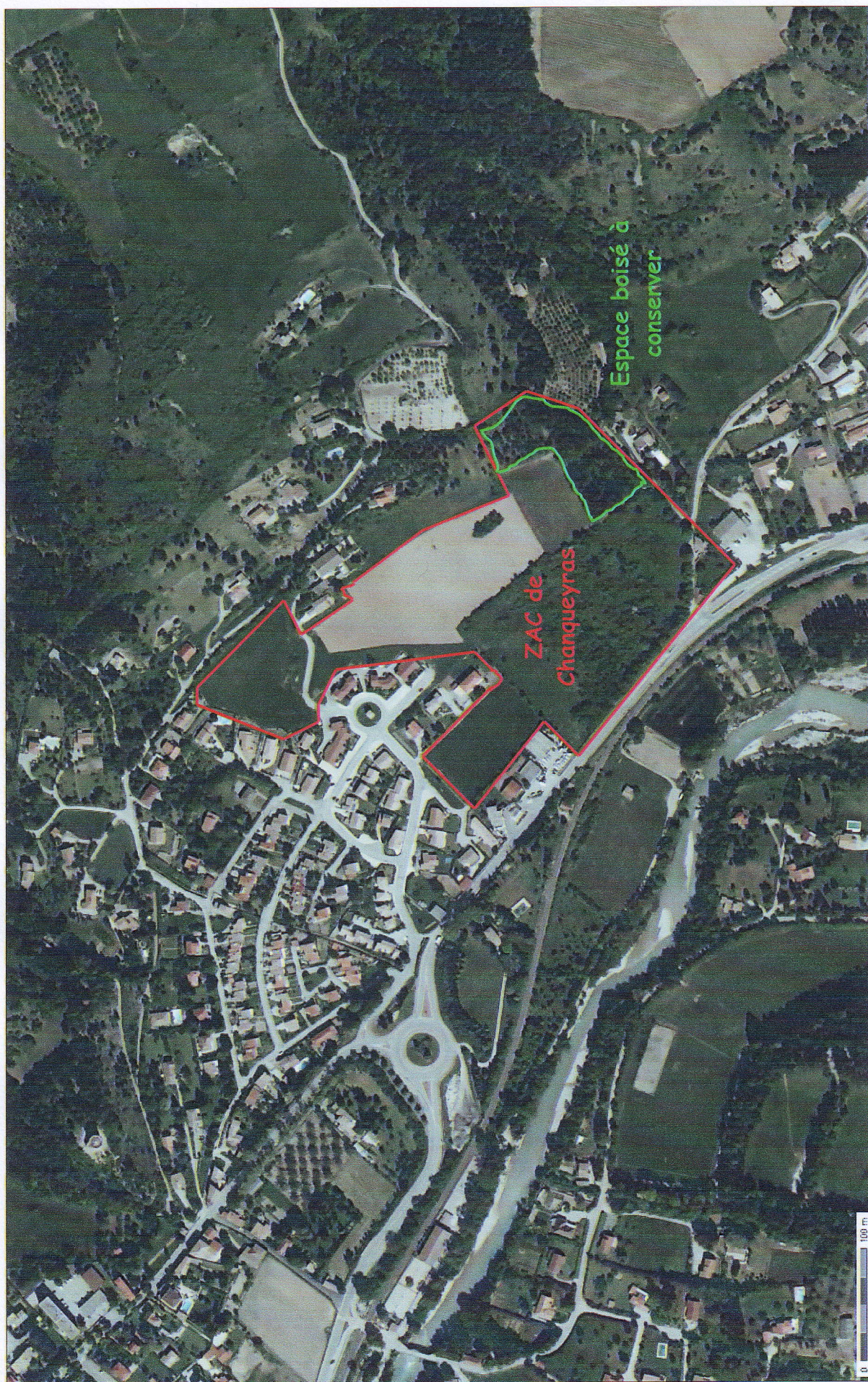
Périmètre de la ZAC