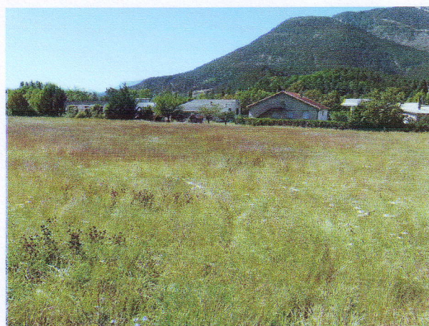
4. Chanqueyras 3 août 2012