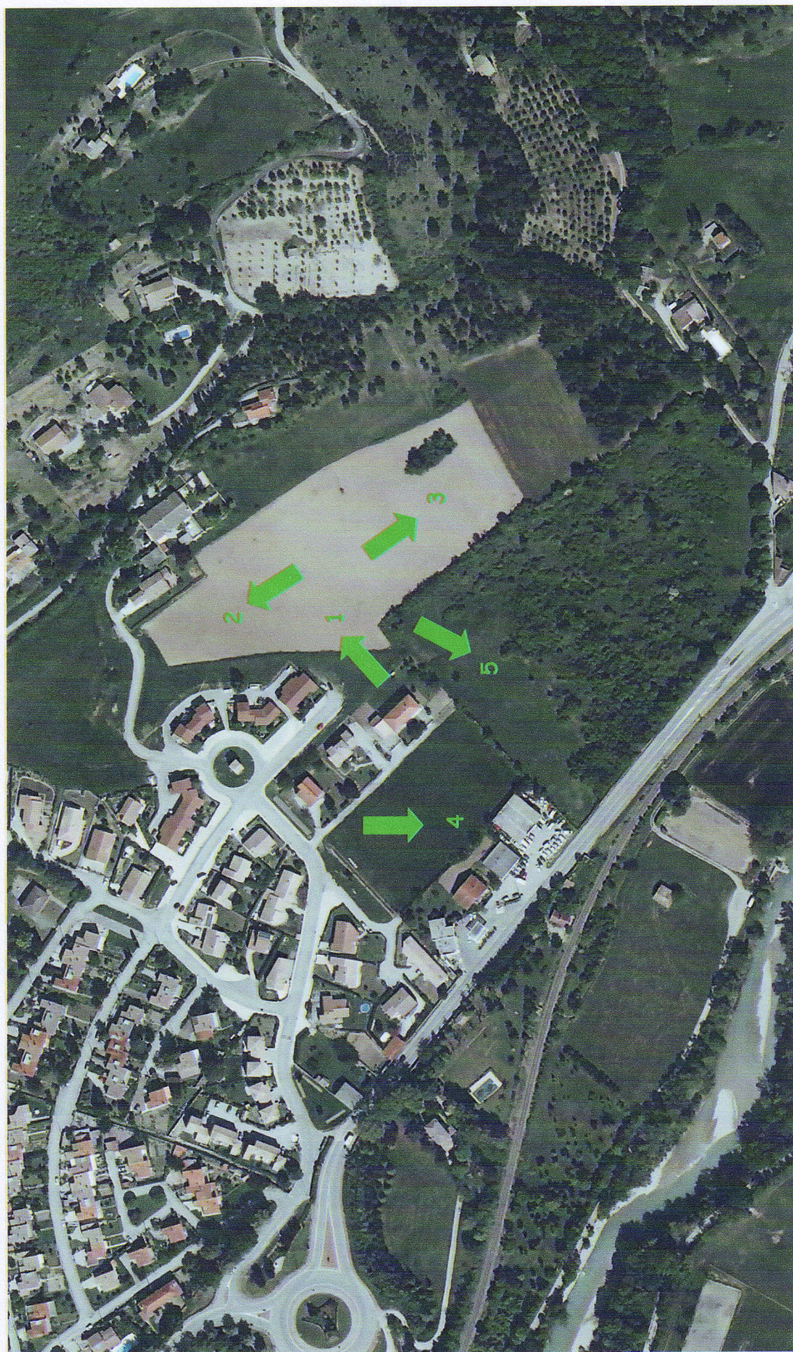
Projet ZAC Chanqueyras : Localisation des photos