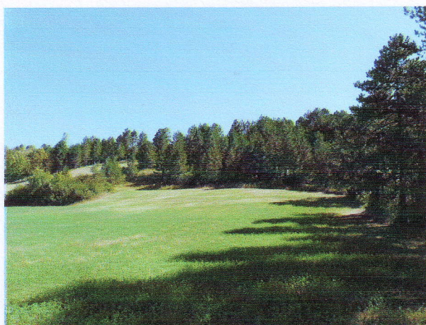
3. Chanqueyras 3 août 2012