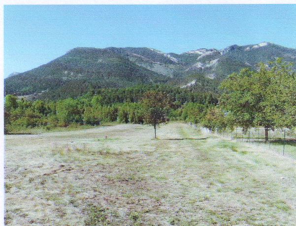
5. Chanqueyras 3 août 2012